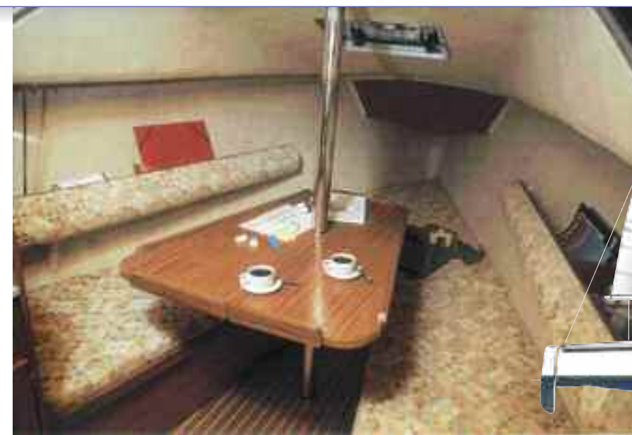
Il Gib'Sea era stato studiato per offrire in sette metri e trenta il massimo del confort possibile

Basta osservare lo specchio di poppa, ampio quasi quanto il baglio massimo che con i suoi due metri e mezzo raggiungeva il valore più alto rintracciabile nelle imbarcazioni appartenenti alla stessa categoria realizzate dalla concorrenza. Inoltre, gli slan-